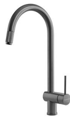
VOLTA GUN METAL 8491 106