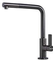
VELA PLUS GUN METAL satiniert 8498 126